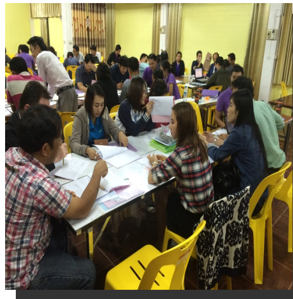
ภาพที่ ๖ ปฏิบัติการกลุ่ม