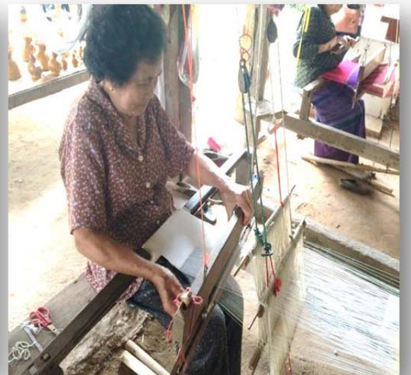
ภาพที่ ๑๒ หัตถกรรม การทอผ้า การจักสาน และ แกะสลัก