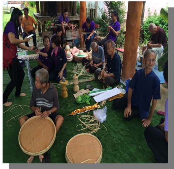
ภาพที่ ๑๑ โครงการส่งเสริมอาชีพการแปรรูป