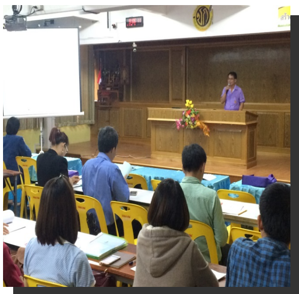
ภาพที่ ๑ พิธีเปิดโดย นายกองค์การบริหารส่วน ตำบลเปือ

เมื่อวันที่ ๑๓ - ๑๔ กันยายน ๒๕๕๙ โครงการอนุรักษ์พันธุกรรมพืชอันเนื่องมาจากพระราชดำริ สมเด็จพระเทพรัตนราชสุดาฯ สยามบรมราชกุมารี (อพ.สธ.) จัดประชุมกลุ่มปฏิบัติการ สมาชิกฐานทรัพยากร ท้องถิ่น ภาคเหนือตอนบน ณ โรงเรียนเชียงกลาง “ประชาพัฒนา” อำเภอเชียงกลาง จังหวัดน่าน เพื่อให้ สมาชิกรู้และเข้าใจ แนวทางในการดำเนินงาน รวมถึงการปฏิบัติการในพื้นที่ศึกษาขององค์การบริหารส่วน ตำบลเปือ อำเภอเชียงกลาง จังหวัดน่าน เช่น โครงการส่งเสริมอาชีพการแปรรูปกล้วย ศูนย์เรียนรู้บ้านส้อ วิถี ชุมชนเพียงพอ และศูนย์การเรียนรู้สมุนไพรพื้นบ้าน การประชุมกลุ่มครั้งนี้มีหน่วยงานเข้าร่วม จำนวน ๒๔ แห่ง จำนวน ๙๗ คน