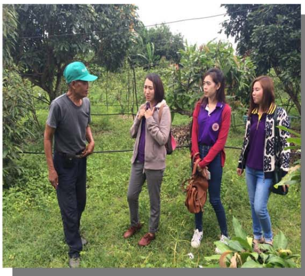
ภาพที่ ๙ สวนเศรษฐกิจเพียงพอ